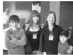
Carine and Co